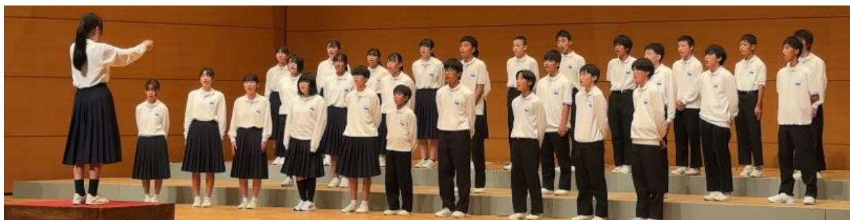
学年最優秀賞の2年4組

合唱コンクールと文化祭が無事終了しました。音楽の授業と2週間足らずの放課後練習で仕上げてきたクラス合唱は、どのクラスも良いものに仕上がっていました。特に、合唱コンクールから文化祭までの2日間での伸びっぷりには驚きました。歌声を整えていくことで、みんなの心まで整い揃った証だと思えます。また、他クラスの合唱を聞きみんなの姿勢には本当に成長を感じました。一生懸命頑張る仲間を温かく見守る…簡単なようでなかなか難しいことです。結果的に下克上はできませんでしたが、3年生は正直あせったと思えますよ。来年は歴史に残る合唱を作り上げてくれることを期待します。指揮者、伴奏者、パートリーダーなど取り組みを支えてくれた人たちに感謝します。