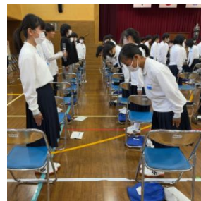
マナー講座の一幕